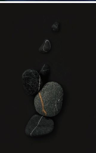
『流され、転がり、丸まり、繋がる。』