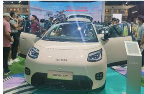
【AION(中国EV)の展示ブース】

2025年3月26日から4月6日の期間、第46回バンコク国際モーターショーがバンコク郊外のイベント会場「インパクト・ムアントンタニ展示場」にて開催され、約160万人が来場しました。本イベントは、東南アジア最大規模の国際モーターショーで、会期中に自動車やバイクの展示即売が行われるのが特徴です。年々、EVを中心に中国系メーカーのプレゼンスが大きくなっており、売り上げを伸ばしています。