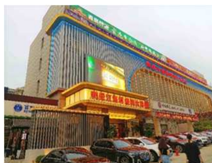
【有名塾「百家教育」から海鮮バーベキュー店「鴨綠江」へ】（写真はいずれも大連事務所撮影）