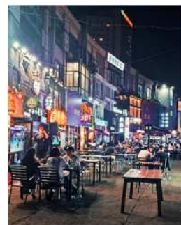
【人気の屋台バーベキュー】

夏になると、全国から大勢の観光客が大連に集まり、海辺バーベキュー料理と海のレジャーを楽しみます。