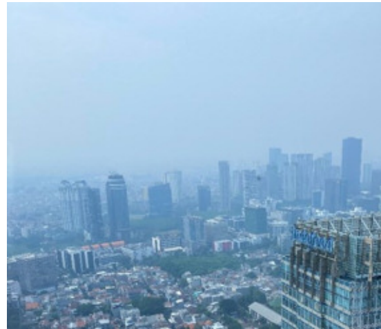
【インドネシア出張時に撮影したジャカルタの大気汚染状況(2022年6月24日撮影)】

現地メディア(Antara News)によると、ジャカルタ州政府は昨今の的大気汚染悪化への対応策を急遽発表しました。ただし、四輪車の定期的な排出ガス点検、公共交通機関や環境にやさしいエネルギーの利用促進など即効性に乏しい内容となっています。東南アジアで最悪となってしまったジャカルタの大気汚染改善は待ったなしです。