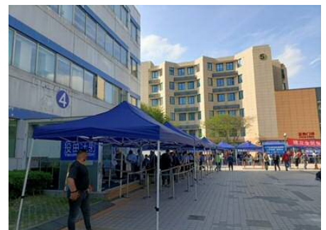
【受付後、会計手続きへ】

数日前にはワクチンを接種した韓国人女性急死のニュースがあり、さらに、接種された方々から「接種した夜に気分が悪くなった」、「接種翌日に肩が上がらなかった」、「接種翌日に微熱が出た」等の話も聞いていたため少々緊張しての接種となりましたが、今のところ特段症状もなく安心しています。