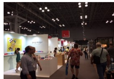
【「NEW YORK NOW」会場内の様子】