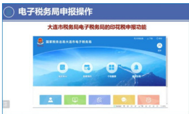
税務局の「電子税務局」 (印紙税以外の様々な税務申告もできる)

従来の印紙税の納付は、税務局で収入印紙を購入し契約書などに貼るといったような伝統的な方法が主でした。コロナ発生以降、税務局を含む中国の行政機関はオンライン申告（非接触業務）を積極的に提唱しており、これからは税務局のシステムで印紙税の申告と納付を行うようになります。