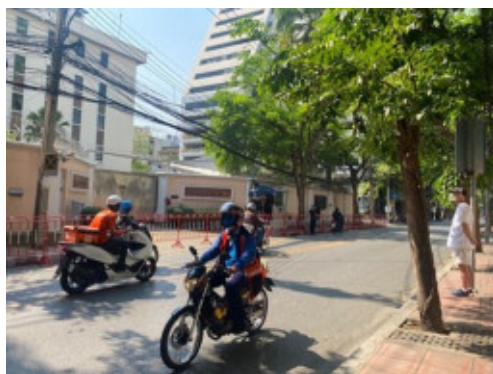
【在バンコクロシア大使館前でウクライナ国旗のマスクリボン身に付け抗議する男性(右側直立の男性)】

【2019年タイ国観光・スポーツ省発表資料より北陸銀行バンコク駐在員事務所作成】