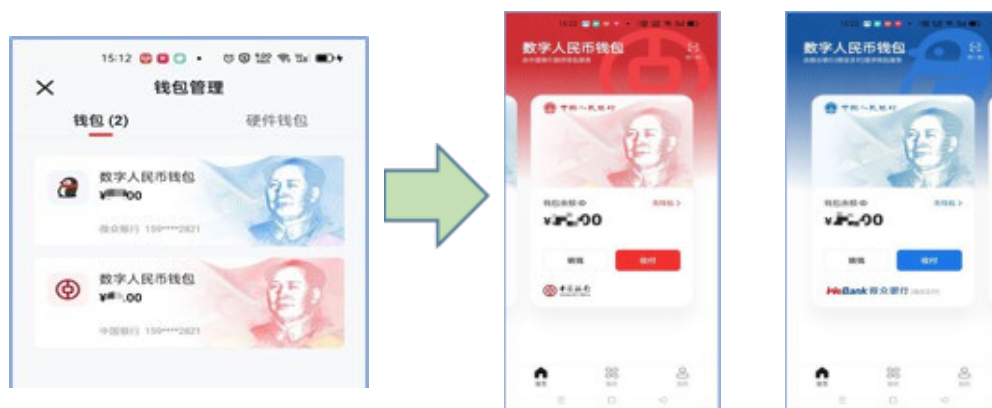
デジタル人民元の財布(資金移動元ごとに財布ができる。左:中国銀行、右:ウィーチャット)

「デジタル人民元」は、34の大手銀行やウィーチャット、アリペイとも連携しており、これらの口座から「デジタル人民元」の財布に資金を移動させることができます。