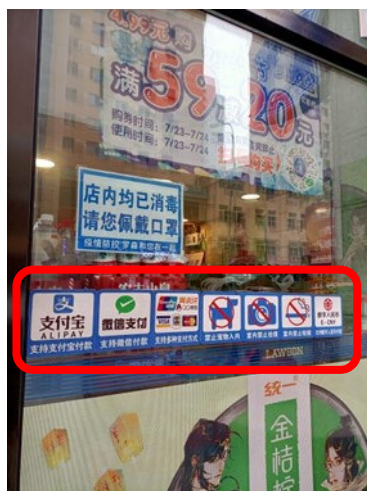
ローソンの入口に様々な 支払方法が表示されている

最近では、さらに「デジタル人民元」決済が出てきました。近所のローソンにも「デジタル人民元決済を利用しよう」という看板がレジに目立つように貼ってあったので、早速体験してみました。