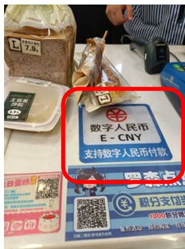
ローソンのレジに貼ってある 「デジタル人民元支払を支持」が目立つ