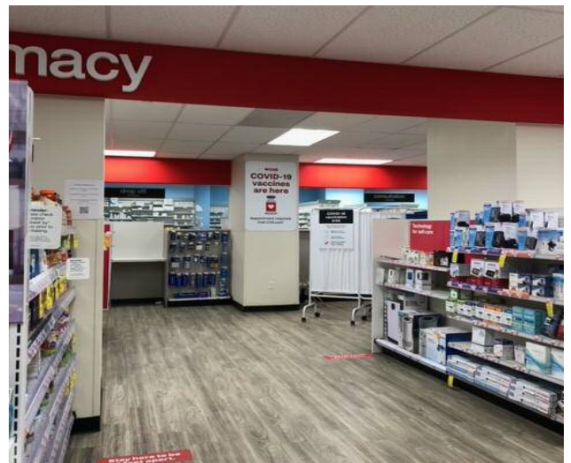
【NY市内 ドラッグストア店内の様子。 奥のスペースで常駐の薬剤師がワクチンを接種】

病院、診療所などの医療機関に加え、1日に1,000人の接種が可能なイベント施設、ヤンキースやメッツのスタジアム、博物館、学校、老人ホーム、教会、公民館等の施設が使用されていますが、今回注目されたのが、全米に150,000店あるドラッグストアチェーン店です。CVS/ファーマシー(9,962店舗)やWalgreens(9,277店舗)などの大型チェーン店は、日用雑貨食品販売と薬局業務に加え、2000年からはインフルエンザや溶連菌感染症などのウイルス感染テスト、さらにインフルエンザの予防接種サービス等を行ってきました。そのため、今回の行政からの新型コロナウイルスのPCR検査やワクチン接種要請にも迅速に対応できたようです。