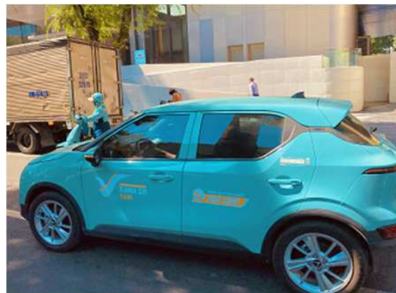
【最近よく見かけるようになったXanh SMタクシー】