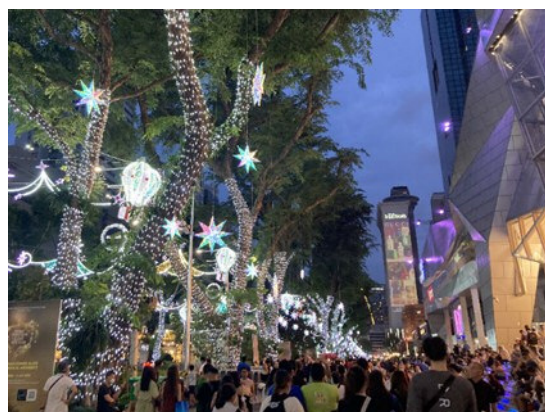
【ビル壁にプロジェクションマッピングが映し出される】

パンデミック前まで中国人観光客が圧倒的に多かったシンガポールですが、今は欧米やインドネシアやベトナム、インドといった国々から