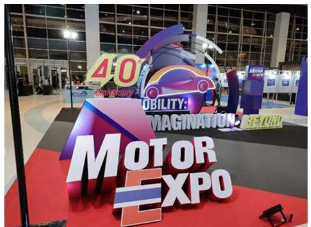
モーターエキスポ会場入口のディスプレイ

タイ政府はタイでEV生産を行おうとするメーカーのEVに税金の優遇措置を与えており、モーターエキスポで確認できたのは、トヨタのガソリン車の自動車税率が20%であるのに対し、BYDのEVは2%と販売価格に大きな影響を与えています。